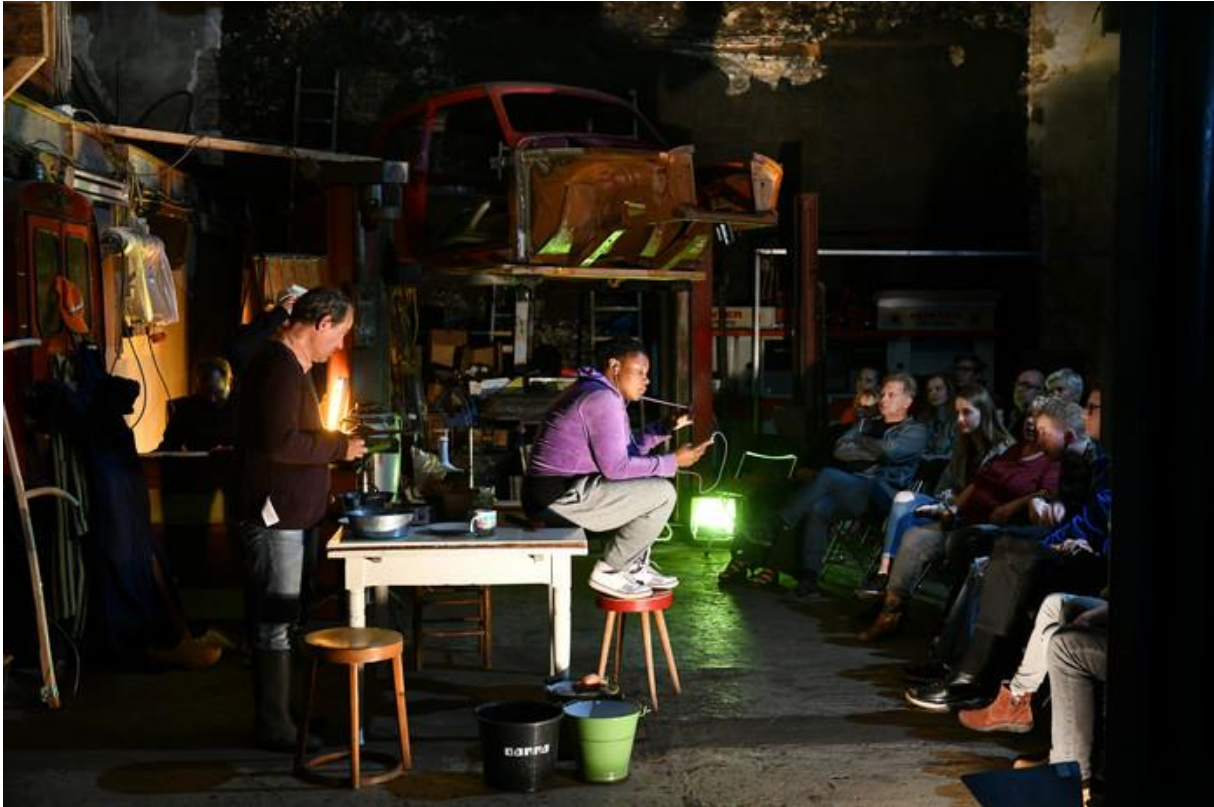
Muziektheater van Flint.